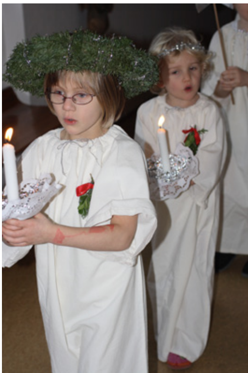
Det traditionelle luciaoptog på Gladsaxe Rådhus 14. december 2009.

gende samfund går hånd i hånd. Og altid har gået hånd i hånd. Det gør det nemmere at forstå, hvad der sker i dag.