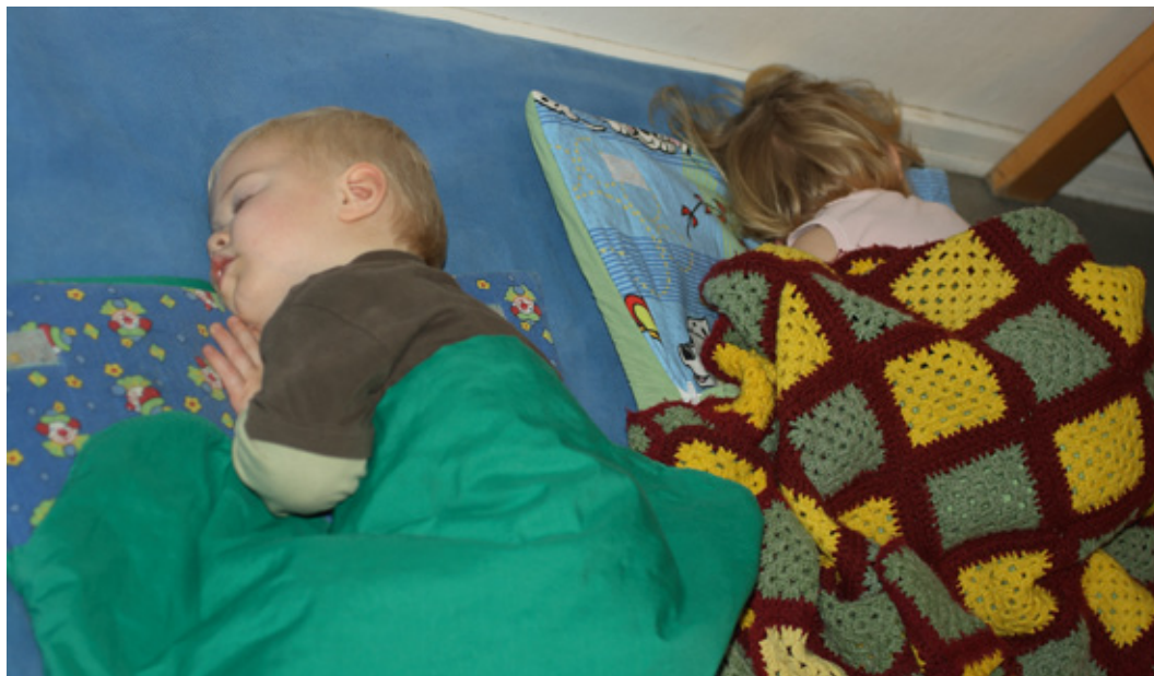
Både to-årige og tre-årige sover sammen på den ene af vuggestuens stuer.

Der er færre pædagoger i vuggestuen om eftermiddagen, end der er om formiddagen. Når børnene sover, går noget af