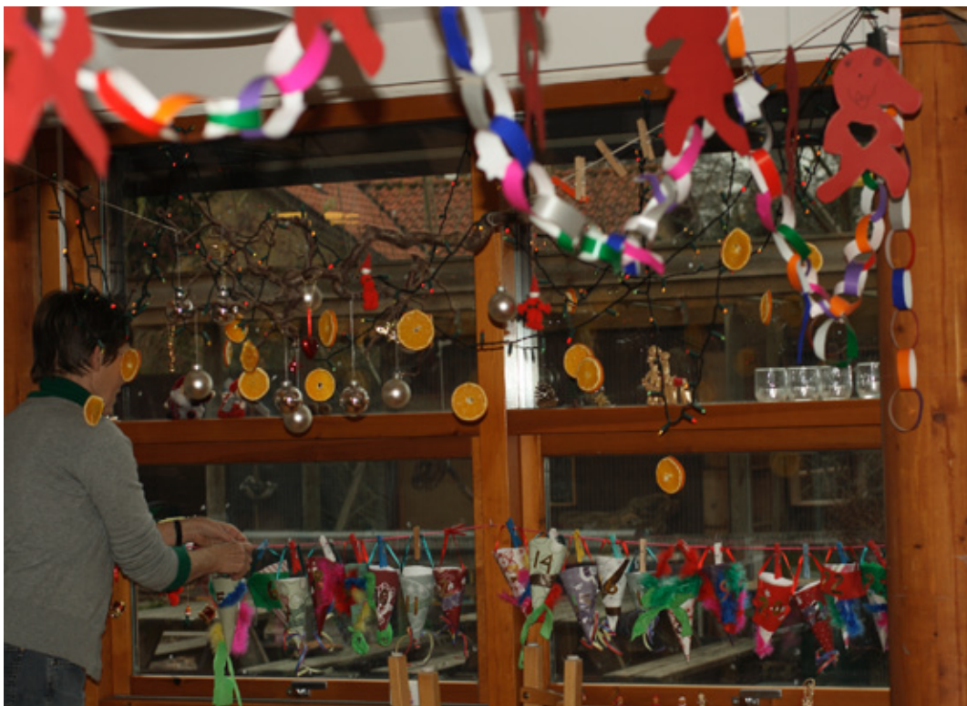
I grøn gruppes stue blev der virkelig pyntet op til jul! Helt vildt med guirlander, troldegren med kugler og alt muligt andet. Det havde taget flere voksne et par fornøjelige timer at forvandle stuen til juleidyl.

Overalt i Vævergården starter dagen for alvor kl. 9 med morgensang. I december sad vuggestuebørnene omkring et fint juletæppe med juledekoration, kalenderlys, julemænd og sang både sange og salmer.