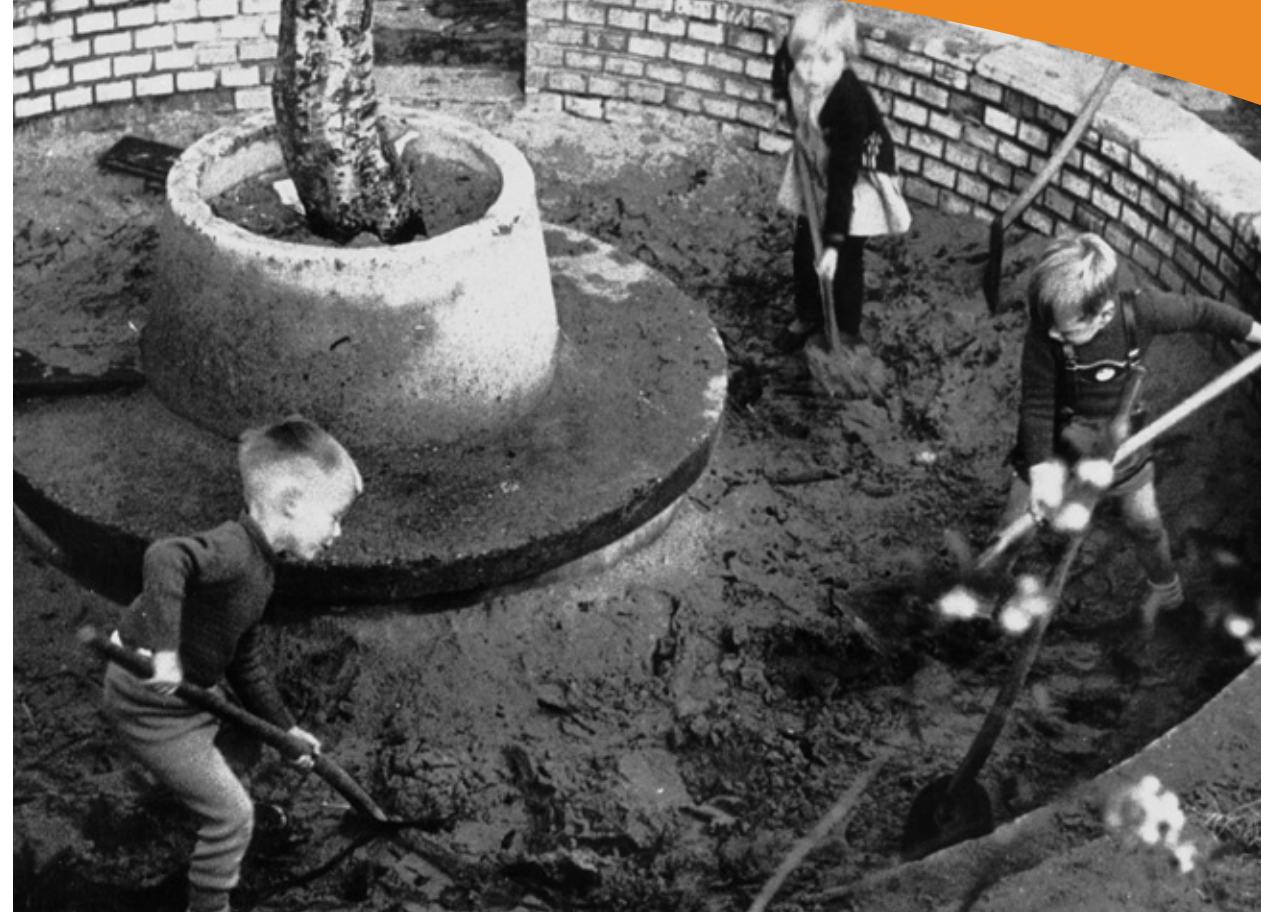
En af PHs mindre fikse ideer var, at plante et kastanjetræ midt i sandkassen. Træet voksede sig hurtigt meget stort og fældede enormt, så sandet måtte næsten udskiftes hvert år. Træet nåede ikke at blive ret gammelt, førend det blev fældet. Fotografiet er desværre ret dårligt, men meget sigende.

I det hele taget bar legepladsen lidt præg af, at det var en arkitekt, Poul Henningsen og ikke en pædagog, som havde tænkt legepladsen. I forbindelse med oprettelsen af legepladsen var der blevet plantet et lille kastanjetræ i midten af sandkassen. Det så yndigt ud, så længe det var lille. Men efterhånden som det voksede, blev det til besvær. Sandet måtte