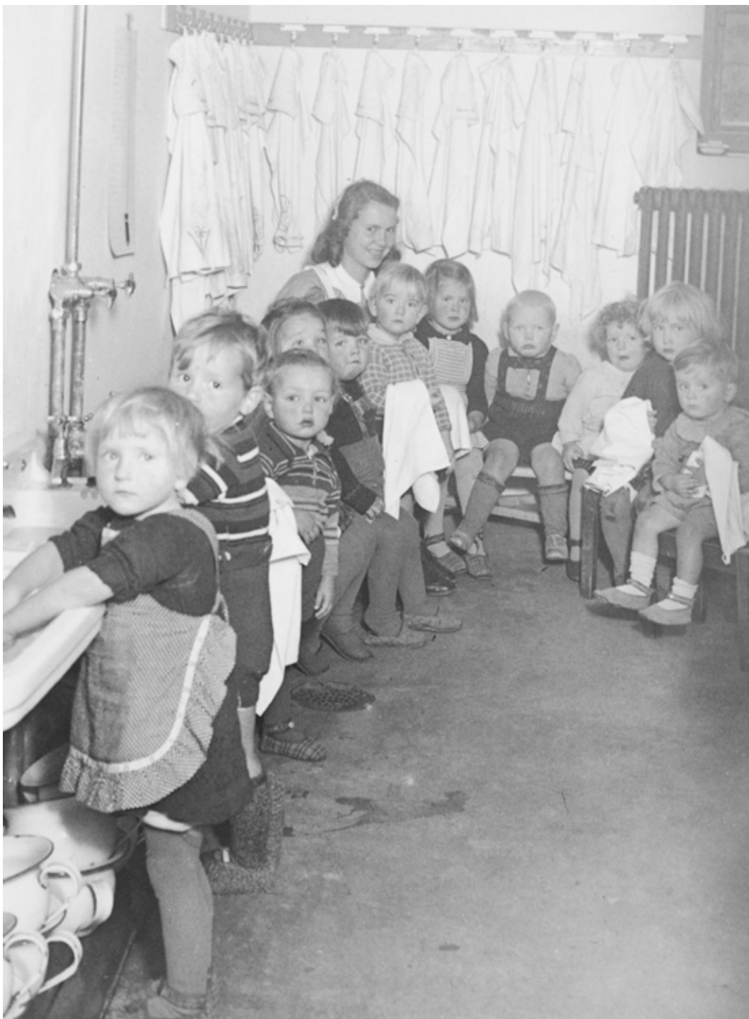
Daghjemmet C.V. Rasmussens Minde. Hygiejne var en del af datidens mantra, når det gjaldt børneopdragelse. Her lærte børnene at vaske hænder selv.

Ved ottetiden spiste de lidt af deres medbragte mad og fik et krus mælk til, og kl. halv ti samledes alle til morgensang. Indtil kl. halv tolv beskæftigede de sig på forskellig vis. Når vejret var godt, legede de under opsyn i haven eller gik en tur. Når det regnede, gjorde de gymnastik eller legede sanglege eller tegnede, lavede farveklip osv.