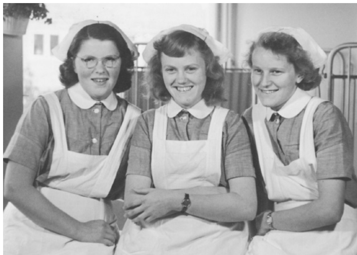
Tre barneplejersker fra Søndergård Parks vuggestue i 1953.

Sideløbende med finanskrisen og kartoffelkur, blev erfaringspædagogikken i 1980'erne og 90'erne til en mere stramt struktureret indlæringspædagogik. Det, man havde brug for ude i samfundet, var i stigende grad folk med uddannelser bag sig – jo længere uddannelse, jo bedre. For pædagogernes vedkommende førte det til, at uddannelsens varighed blev øget til 3½ år. I 1990'erne havde man opdaget, at børn kunne lære hvad som helst – også helt små børn. Her var målet leg og læring, og børnehaven blev nu set som optakt til skolen. I Gladsaxe indførte man årsplaner for de enkelte institutioner. Vævergårdens første årsplan er fra 1994.