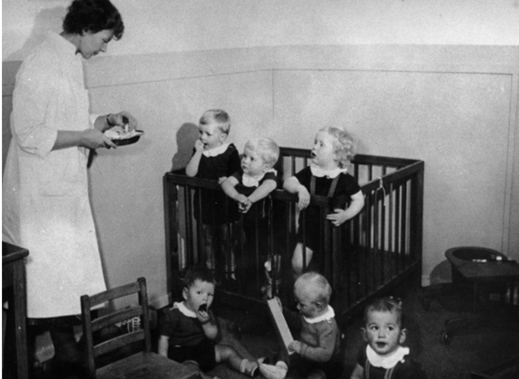
Her er børnene i Dehns Børnehave i gang med et mellemmåltid. 1949.

ved at spise rugbrød hver gang. Derfor var der overvejelser i gang for at få indført egentlig bespisning af børnene. Der var dog en del vanskeligheder af praktisk art i tiden under og lige efter besættelsen. Der var rationering på en del fødevarer, så hvert barn skulle aflevere to grynmærker, to hvedemelsmærker, et smørmærke og to til tre suktermærker pr. kvartal.