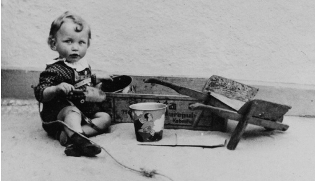
Børnepasning bag slagteren på Bagsværd Hovedgade 121. Hvad skulle forældrene gøre, når de ingen pasningsmulighed havde?