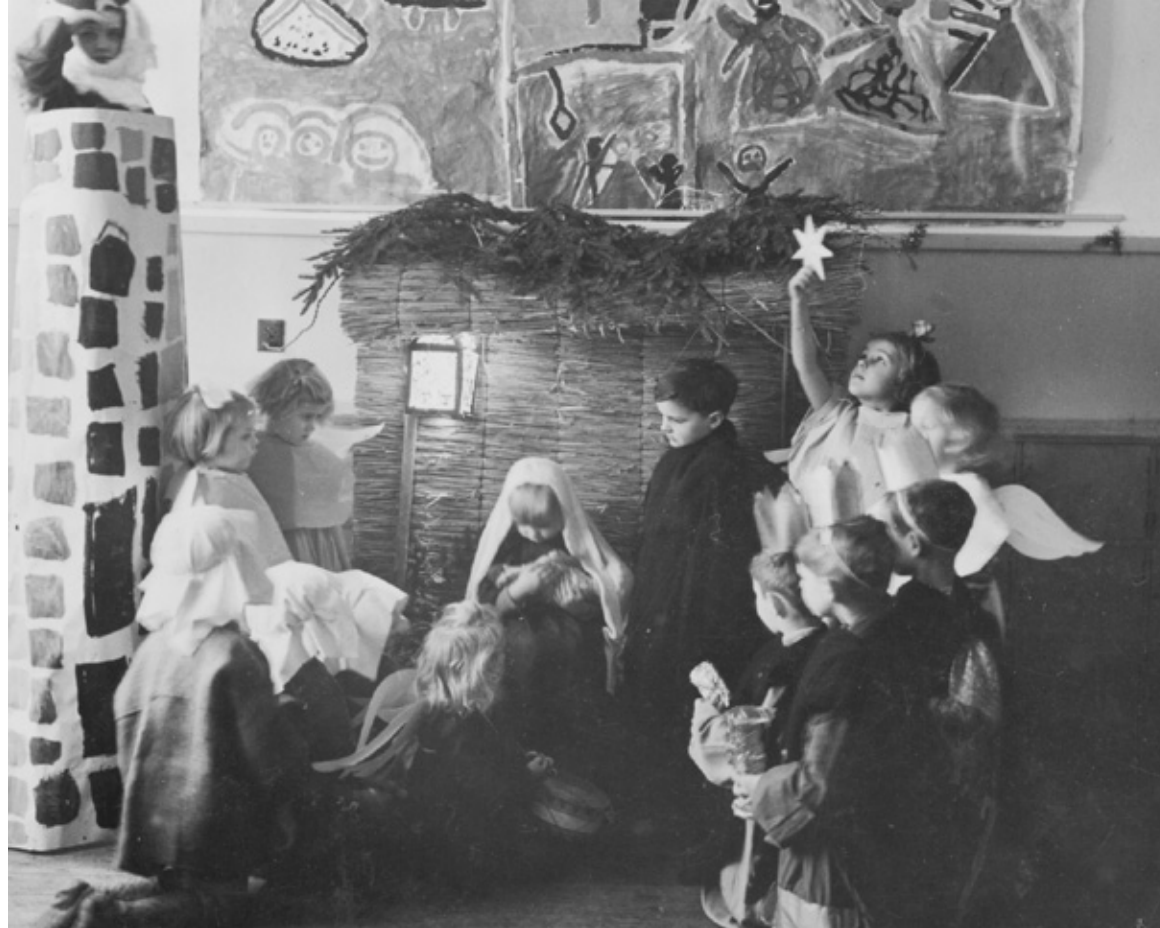
Krybbespil i Buddinge Børnehave 1947.