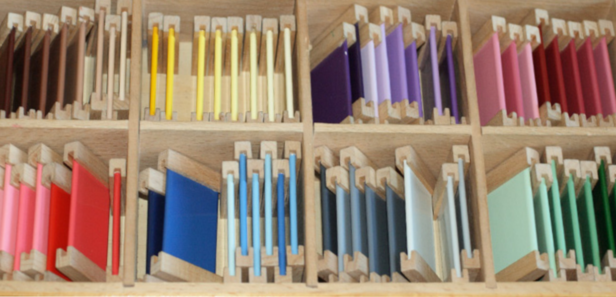
Farvevindler var en del af det legetøj, der skulle udvikle børnenes farvesans i montessoribørnehaverne.