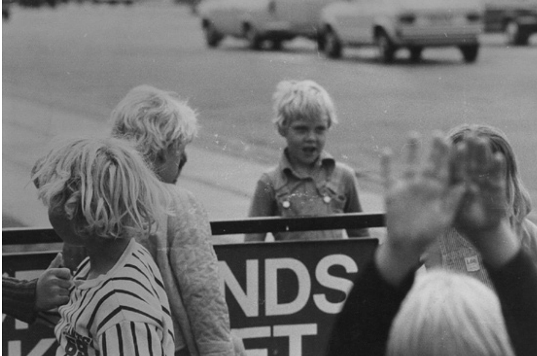
På sommerlejr med Buddinge Børnehave i Bjørnstrup i Jylland, hvor børn og voksne blev indkvarteret i forsamlingshuset. Siden fik børnehaven sin egen grund forærende til den årlige sommerlejr, men da det blev for dyrt for én børnehave at drive, blev sommerlejren omdannet til Gladsaxe Børnehavers Sommerkoloni.