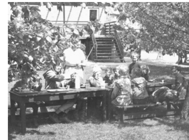
Buddinge børnehavn, hvor man har rykket frokosten udenfor.

På Krisedaghjemmet Solvang arbejdede man på at få etableret bespisning af børnene. Arbejdstiden var lang for forældrene, og det kunne knibe med også at nå at lave varm aftensmad, når de kom trætte hjem. Børnene, der var i børnehaven i mange timer, måtte have mad flere gange. De havde ofte vanskeligt