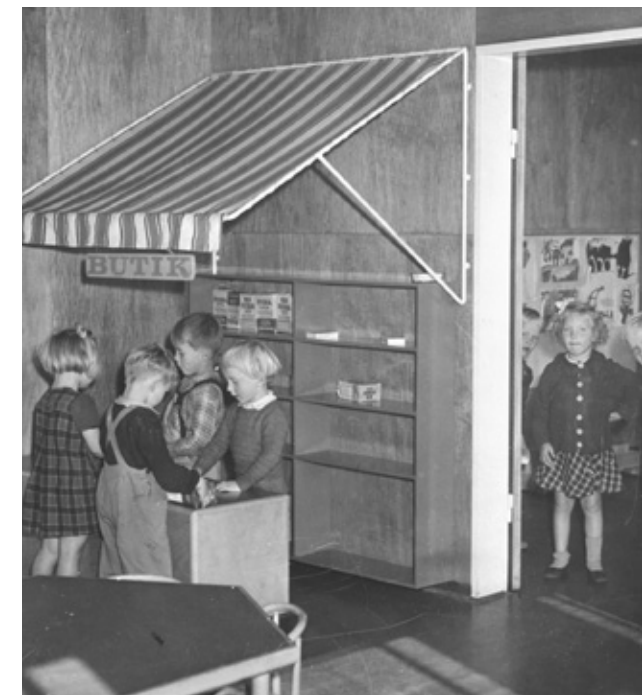
Legerum i Vibevængets Børnehaven på Vibevænget 5 i 1948.