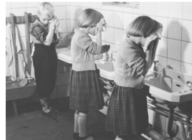
Daghjemmet C.V. Rasmussens Minde. Tre af de større børn vasker sig i ansigtet inden spisning. De store børn, der gik i skole, blev efter skoletid hjulpet med lektier.

Der blev indrettet to spædbørnestuer i stuetagen. Den ene til tolv "sengebørn" på 0 – 3/4 år, den anden til tolv kravlebørn på 3/4 – 1 1/2 år. På første sal blev der indrettet to legestuer til 30 "legebørn" på 1 1/2 - 3 år. Andensalen blev indrettet til personalet. Der var ansat en leder og en assistent, der begge var sygeplejend-