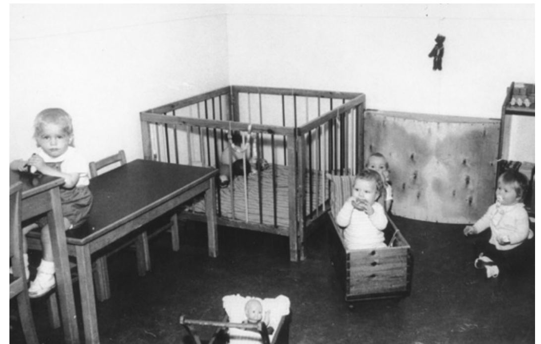
Legende børn i Dehns Børnehave 1949.

Børnehaven åbnede kl. 6 om morgenen. Alle børn skulle være kommet inden kl. halv otte. Børnene afleverede først deres tøj nede i garderoben sammen med det mærke, hvert barn havde fået: en firkantet træplade med en farvelagt tegning af f.eks. en svane eller en bold, en bamse, en tyrolerhat, eller hvad man nu kunne finde på. Derefter blev børnene placeret på de små "muntert kolorerede" glaspotter, så blev de vasket og friseret.