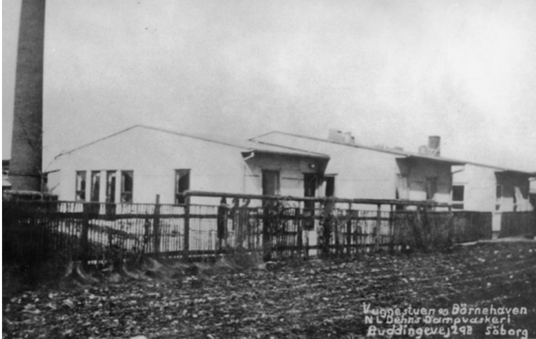
Dehns Vaskeri udvidede med egen børnehave - og sidenhen også med en vuggestue - for de ansattes børn. Børnehaven blev, ligesom resten af vaskeriet, tegnet af Poul Henningsen, og indrettet i tre brugte flygtningebarakker, som virksomheden fik lov at købe billigt efter krigen. De tre barakker lå i forskellige niveauer og med hver sin indgang.