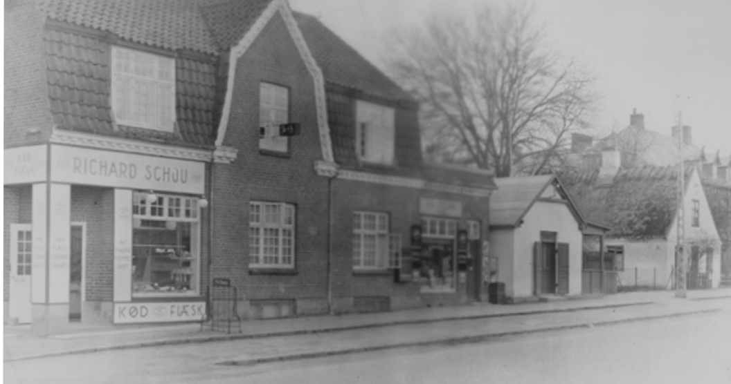
Bagsværd Hovedgade 149 ved hjørnet af Pinjevej. Det lille hus i midten var Bagsværd Asyl 1936.