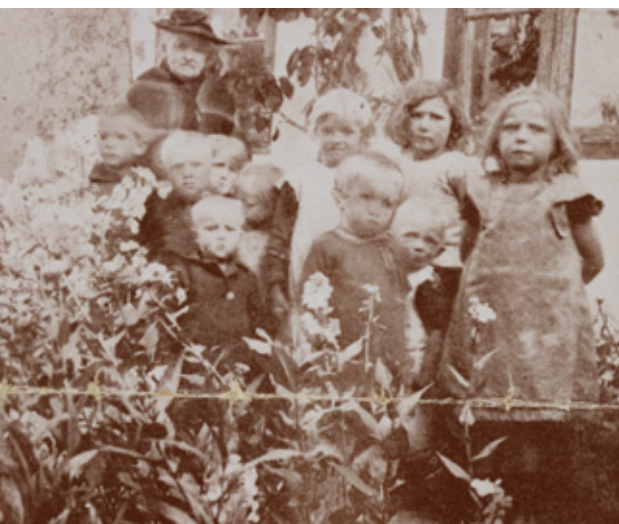
Bagsværd Asyl i 1913. Her ses asylmoder sammen med børnene, som blev passet på asylet. Asylet lå på Bagsværd Hovedgade 153.