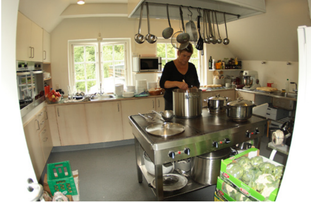
Det nyrenoverede køkken og kokken. 2009.

Den aldersudvidede institution Vævergården blev til børnehuset Vævergården og en af områdeinstitutionerne i Bagsværd/Søndergård distrikt. I praksis betyder det, at Vævergården ikke længere f.eks. skal have sin egen forældrebestyrelse. Der findes en forældrebestyrelse, men den er for hele distriktet. Vævergården selv har et kontaktudvalg med forældrerepræsentation. Den nye struktur er en lettelse for børnehuslederne, som har fået færre møder.