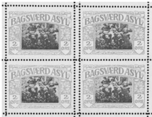
Dette velgørenhedsfrimærke blev solgt fra Bagsværd Asyl i 1909.

Det var ikke blot asylet, som benyttede sig af at tjene penge til institutionen ved