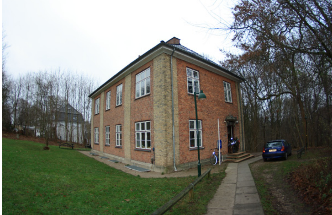
I denne bygning på Bagsværdvej 144B holder Natur- og Sejlklubben til.

Natur- og Sejlklubben blev oprettet i maj 1982 for at fremme sejlsportsinteressen, interessen for kano- og kajaksport og andre interesser der knytter sig til Bagsværd Sø. Klubben er en slags andelsforetagende, som ikke er finansieret direkte af kommunen, men indirekte via de enkelte