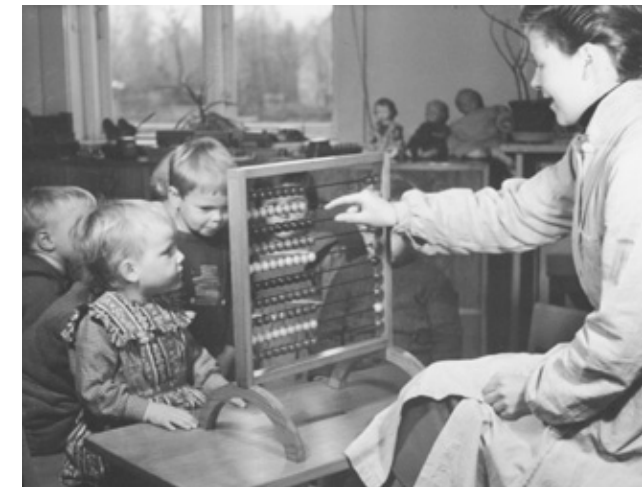
Daghjemmet C.V. Rasmussens Minde. Børnene og en assistent regnede på kugleramme. 1950.

Det var dog ikke nemt at få sognerådet til at give penge til legetøj. Ifølge referatet af socialudvalgsmøde den 6. november 1944 fremgår det, at frk. Jensen i de