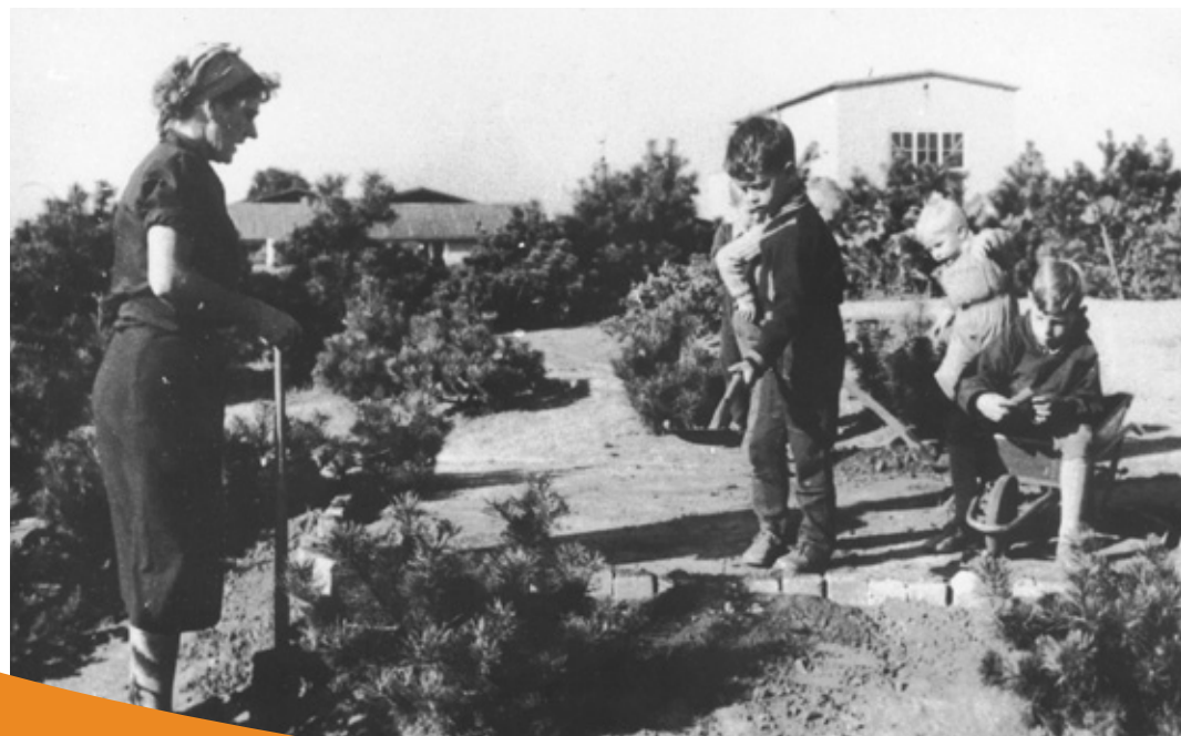
Dehns børnehave 1949. Til børnehaven hørte en stor have, som børnene var med til at tilplante. Jorden til vaskeri og børnehave var udstykket fra et gartneri, som lå umiddelbart op til børnehavens have.

skiftes ustandseligt, fordi det blev snavset af nedfaldne blade, og en dag blev det for meget, og træet blev fældet.