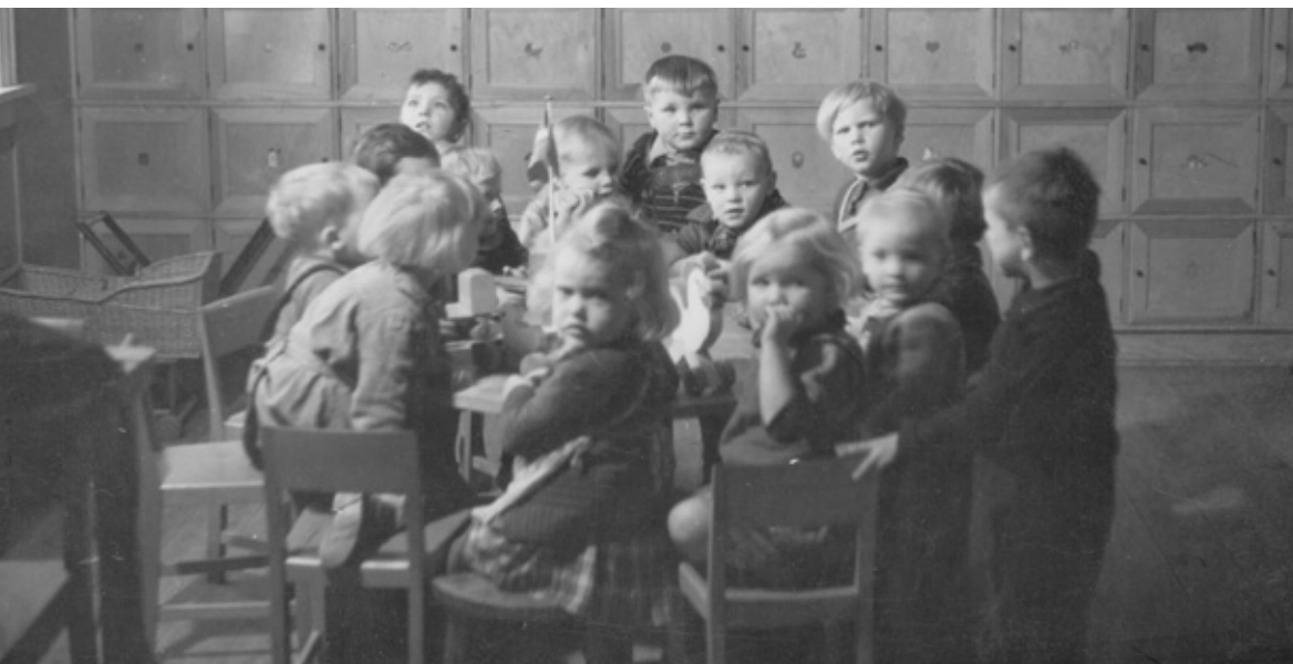
Bagvæggen var indrettet med skabe, hvori legetøjet befandt sig. Solvang, 1945.

Thea ønskede en "dukkekrog" i den ene stue, så børnene kunne få det lidt mere intimt, end det ellers var muligt på en institution. Hun havde også nogle ønsker om legemateriale. Hun havde i øvrigt taget en stor tavle og en rutsjebane med hjem fra en tur til Sverige. Børnene var meget glade for disse ting, så hun ønskede, at børnehaven kunne overtage dem.