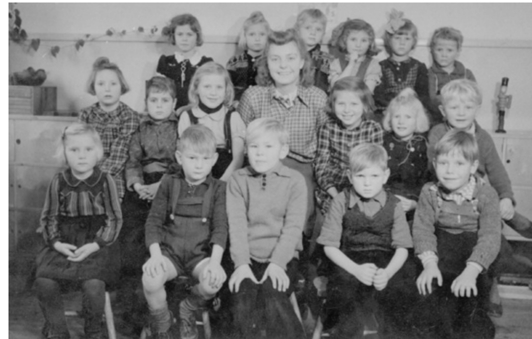
Buddinge Børnehave startede 1. september 1940 med 51 børn mellem 2 og 7 år. Huset er blevet udvidet flere gange. Her ses alle børnene i 1945.

på 14 dage. Endvidere var der i starten blot ansat lederen og en medhjælper til at passe ca. 50 børn.