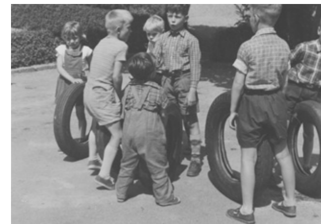
Daghjemmet C.V. Rasmussens Minde d. 14. juni 1957. Drengene havde fundet sig nogle store bildæk at trille med. Giver: Ingrid Voss-Jensen.

C.V. Rasmussens Minde. Udendørs var der et lille hjørne af haven, hvor børnene kunne lege. Resten af haven måtte de ikke komme i.