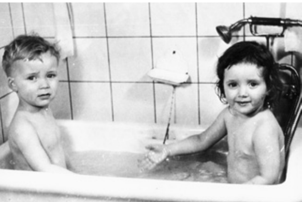
Dehns Børnehavn. Børnene her var kommet en tur i et badekar i 1949.

Til højre ses planen for elevarbejde om formiddagen. Retningslinjerne for arbejdet om eftermiddagen var de samme. Hygiejnen i første række. Kun hvis der var tid, kunne eleverne kæle med de små. Stimulere børnene til andet end renlighed og at spise skulle man ikke.