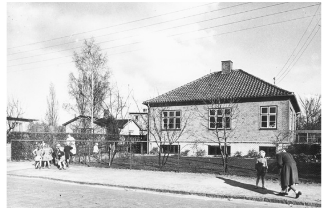
Her ses den bungalow som Gladsaxe Kommune indrettede til krisebørnehave i 1944. Børnehaven åbnede kl. 6 om morgenen og en del af børnene var der indtil lukketid 12 timer senere.

Efter ombygningen var der i stueetagen et køkken og tre værelser, det ene med udgang til terrassen. Fra den stue, hvor de mindste børn skulle være, var der nedgang til kælderen. Stuerne blev tapetseret med børnetapeter med H.C. Andersens motiver. Desuden var der et kontor, som også skulle fungere som isolationsrum. Isolationsstuen blev anvendt som sygestue, hvis det blev nødvendigt. Der kunne anbringes skærme ud for de små senge, hvis flere børn var syge samtidig. I kælderen blev der indrettet garderobe, vaskerum og toiletter, foruden brænd-