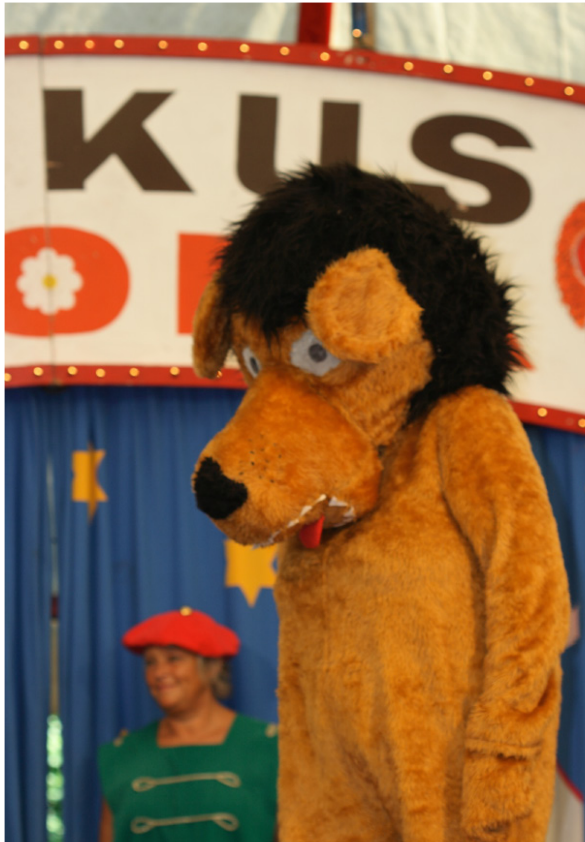
Cirkus Floras Sløve Løve.

Hvert år i slutningen af august bliver et stort cirkustelt slået op på Radiomarken i Bagsværd. Og så kommer alle artisterne: Sløve Løve, den stærke mand, klovnerne,