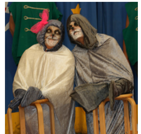
De forelskede søløver i Cirkus Flora.

Eftersom forestillingerne er næsten ens fra år til år, ved mange, hvad de skal opleve. Børnene kommer med første gang, når de er omkring fire år. Og kan dermed nå at se forestillingen op til tre gange, inden de begynder i skolen. Børn, der skal se forestillingen for første gang, har måske ældre søskende, der har fortalt dem, hvad der skal ske. Forventningerne